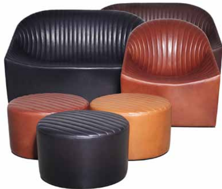
Im Fokus der ersten Zusammenarbeit des Schweizer und der österreichischen Manufaktur: kleine Räume. Polstergruppe OYSTER für Wittmann. Kompakt, leicht und dennoch bequem.