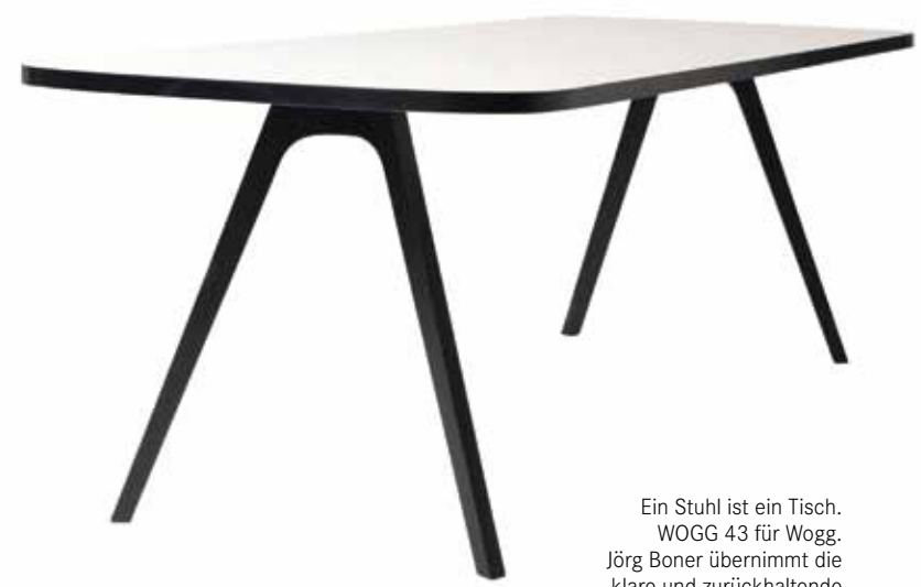
Ein Stuhl ist ein Tisch. WOGG 43 für Wogg. Jörg Boner übernimmt die klare und zurückhaltende Form des Stuhluntergestells von WOGG 42. Fazit: frische, zeitgemäße Ästhetik.