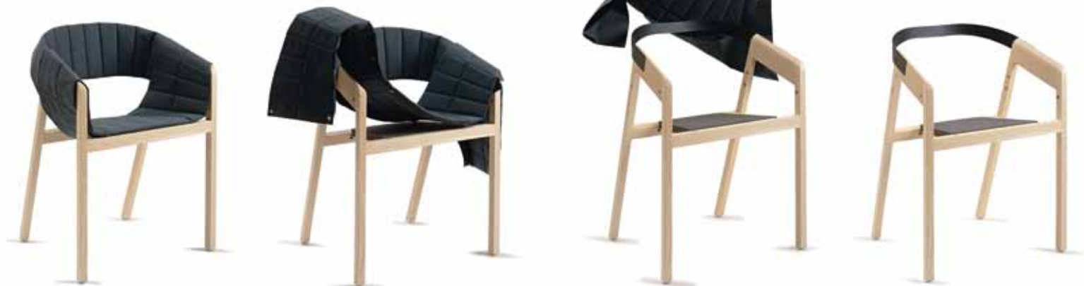
Haute Couture made in Switzerland. WOGG 42 für Wogg. Raffiniert und innovativ ist die zweiteilige Husse des Stuhls. Mit ein paar Handgriffen entfernt, gereinigt und wieder aufgelegt ...

Was mich sehr irritiert, ist, was seit den vergangenen 15 Jahren im Autodesign passiert. Ein trauriges Bild.